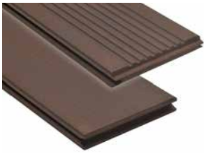
BO-DTHT171G Ranurado / Liso 137 mm (reversible)