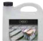
CLEANER-WOCA-01 Woca limpiador para madera de exterior 2,5 l