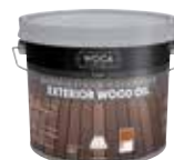
OIL-WOCA-011 Woca aceite para madera exterior color Teka 2,5 l