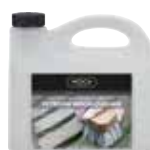
CLEANER-WOCA-01 Woca limpiador para madera de exterior 2,5 l