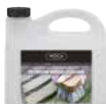
CLEANER-WOCA-01 Nettoyant Woca 2,5 l