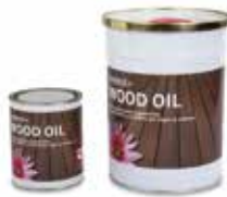
OLIO myDeck+ Wood Oil 1 lt 5 lt - 25 lt