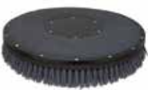
DISK-02 16" Disco con setole al carburo di silicio