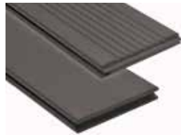
Ranurado / Liso Vintage (reversible)