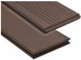
Ranurado / Liso (reversible)