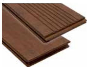
Ranhurado / Liso (reversível)